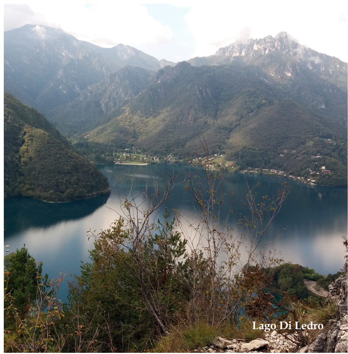
Lago Di Ledro