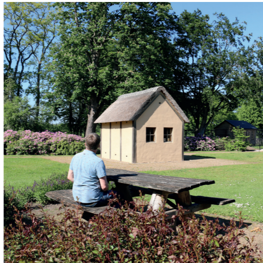
De Laren 10A, 5469 PH Erp