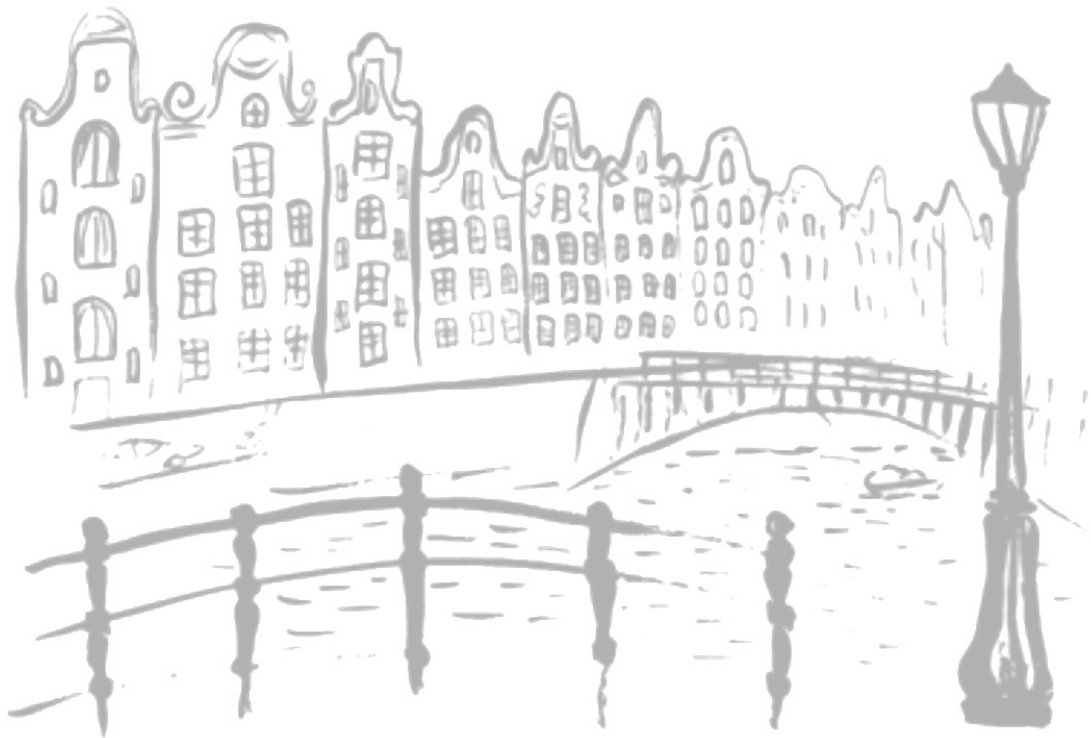
Sissy Hofmeester Burggravenlaan 234 2313JB Leiden