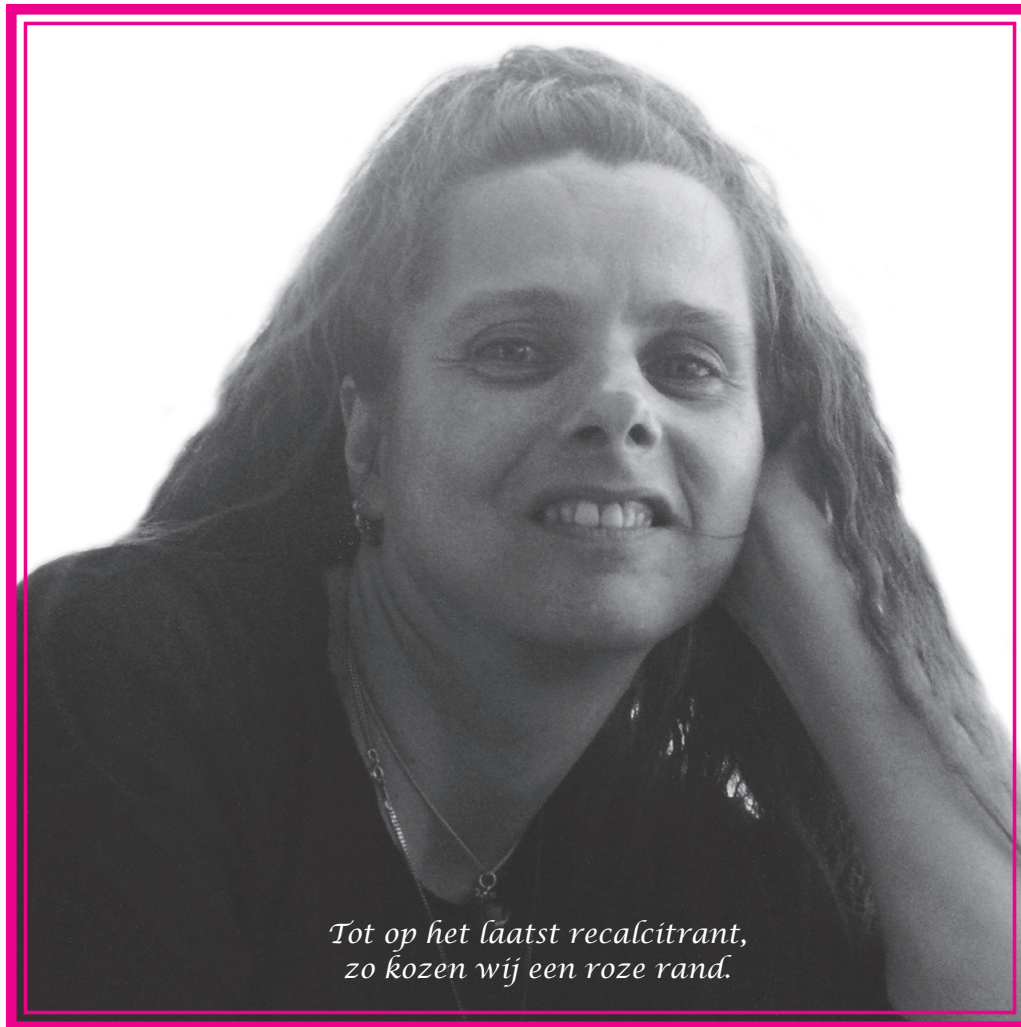
Tot op het laatst recalcitrant, zo kozen wij een roze rand.