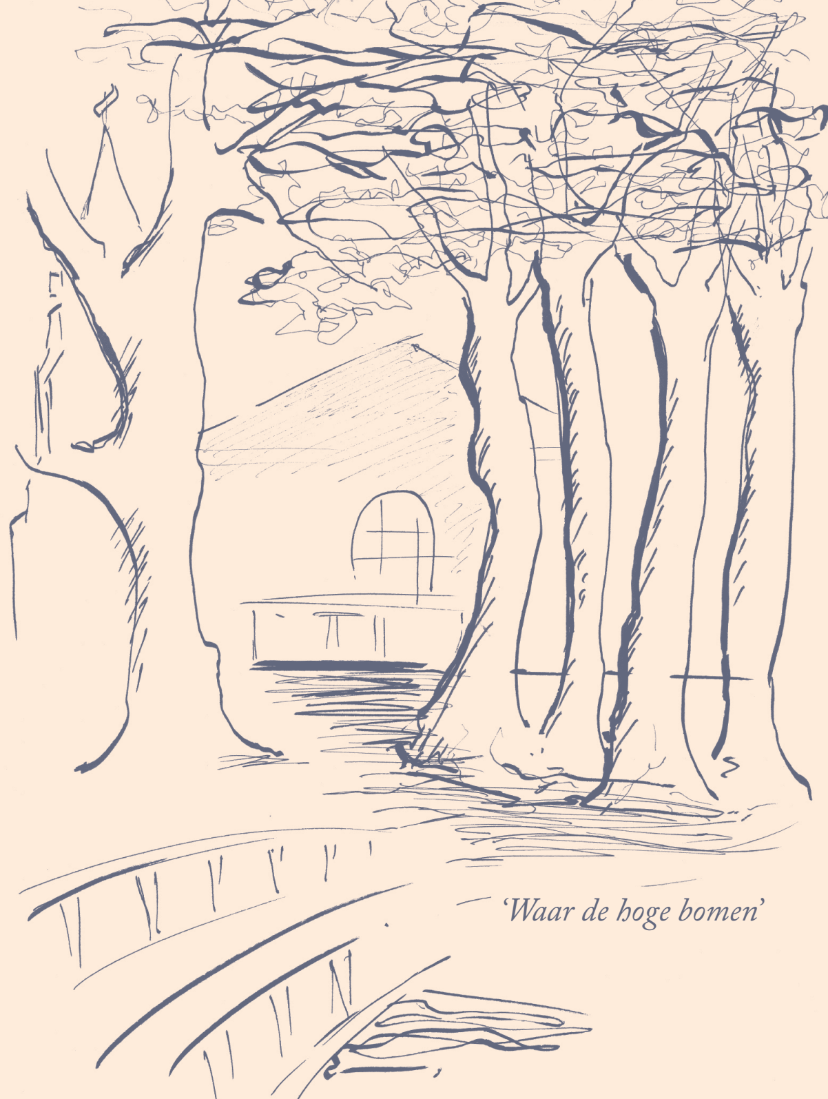
'Waar de hoge bomen'