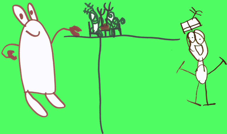
Tekeningen van Feng toen hij 6 jaar was. Hij ging hier tot vorige week mee door.